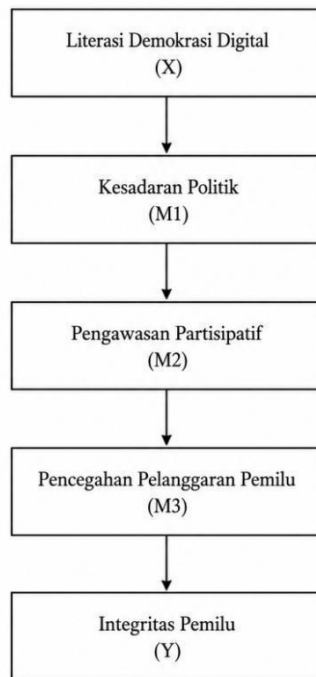
Grafik 1. Konseptual pencegahan pelanggaran pemilu berbasis pemilih muda

Berdasarkan hasil kuantitatif dan kualitatif, penelitian ini menghasilkan model konseptual pencegahan pelanggaran pemilu berbasis pemilih muda. Model ini menunjukkan bahwa pencegahan pelanggaran pemilu tidak hanya bergantung pada penegakan hukum oleh lembaga pengawas, tetapi juga memerlukan pembangunan kapasitas kewargaan digital masyarakat. Generasi muda yang memiliki kemampuan literasi demokrasi digital tinggi cenderung lebih aktif dalam melakukan pengawasan partisipatif dan lebih mampu menjadi agen demokrasi yang kritis. Oleh karena itu, penguatan literasi demokrasi digital melalui pendidikan politik, kolaborasi perguruan tinggi, organisasi kepemudaan, serta program pengawasan partisipatif Bawaslu menjadi strategi penting dalam menjaga kualitas demokrasi Indonesia.